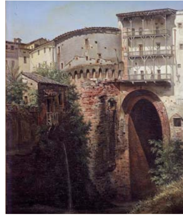
A. Albrespy, Tour Saint-Louis et porte du Griffoul, avant 1881