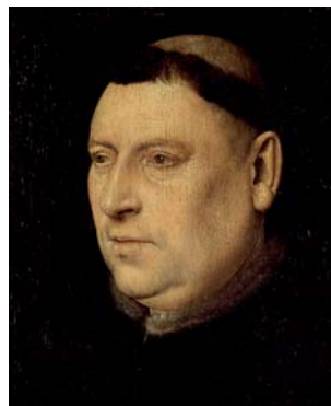
Jan Van-Eyck (école de), portrait de moine , mi XV e

Cette visite pas comme les autres vous propose un parcours original au cœur des richesses du musée Ingres. Faites confiance à vos sens, laissez votre sensibilité s'exprimer, testez votre goût ! Une visite à déguster... !