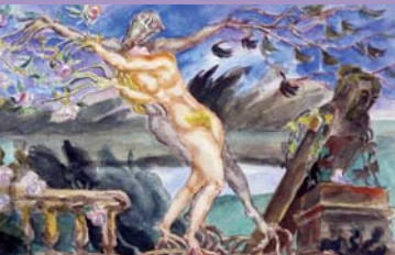
Antoine Bourdelle, mon plan de jardin , 1919

Samedis 3 et 17 avril ; 15 mai ; 12 juin à 15h